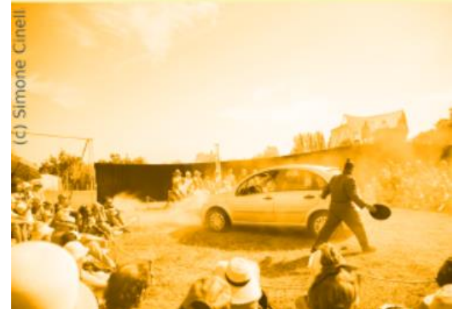
(d) Simone Cinell